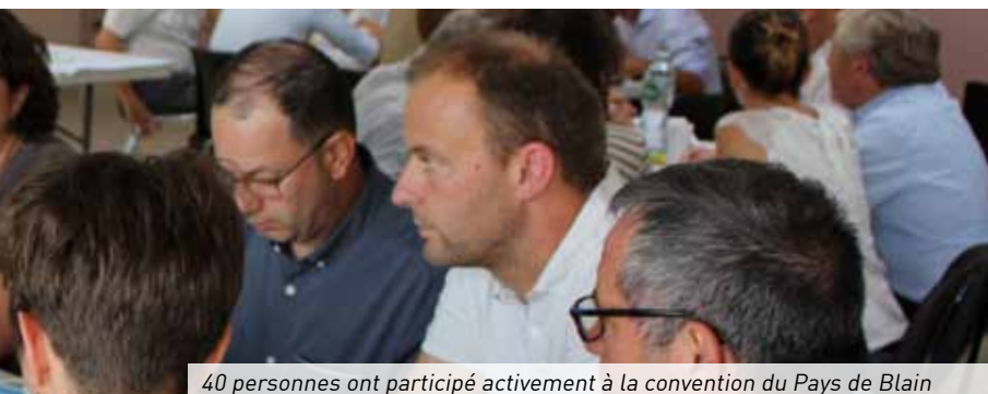
40 personnes ont participé activement à la convention du Pays de Blain

Le 4 juin 2017 au Théâtre de La Chevallerais. Réunissant près de 40 personnes pour la réflexion sur le Plan Local d'Urbanisme intercommunal et les travaux du Conseil de Développement et agents territoriaux ont ainsi permis de recueillir les éléments qui ont fait consensus.