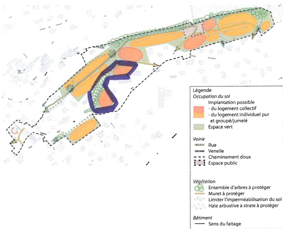
Schéma et principes à valeur réglementaire