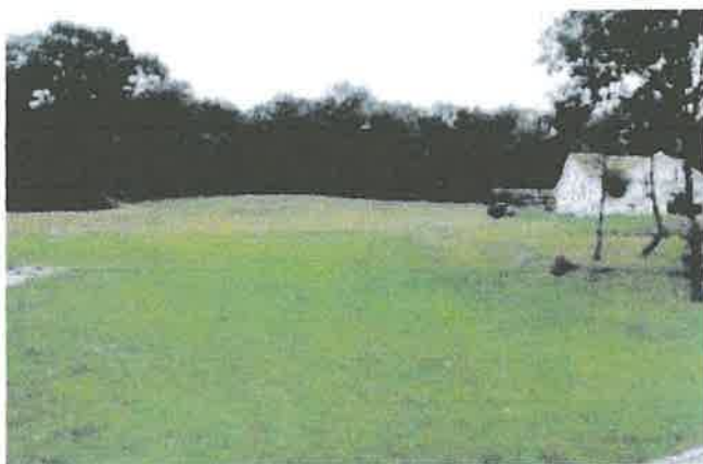
Une disponibilité à proximité des lieux de vie et de la voirie existante