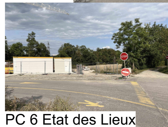
PC 6 Etat des Lieux