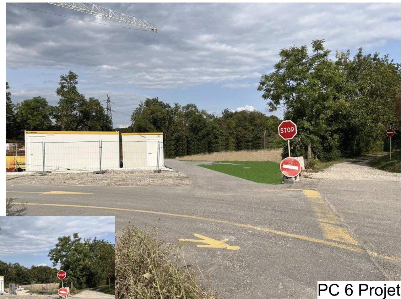
PC 6 Projet