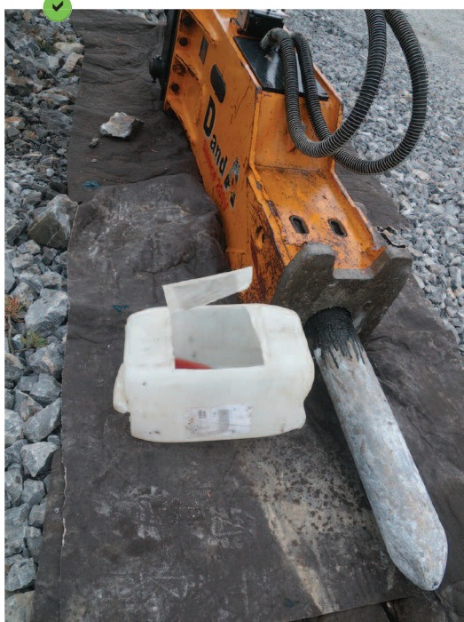
Équipement posé sur géotextile absorbant.