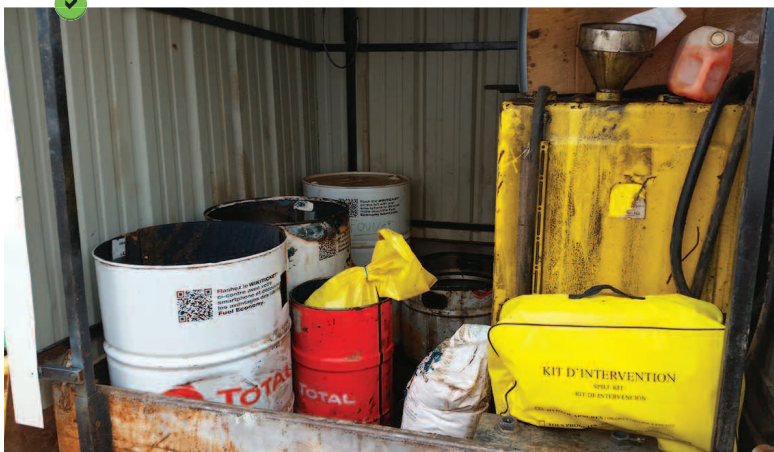
Exemple d'une aire de stockage des matériaux polluants, constituée d'un conteneur/bungalow étanche associé à un kit anti-pollution. Certains produits sont isolés du sol et disposés sur des bacs de rétention.