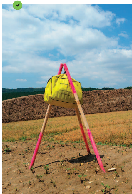
Exemple d'un kit anti-pollution isolé du sol.