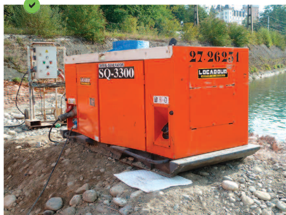
Mise en place d'un géotextile absorbant au point d'alimentation en essence des groupes électrogènes.