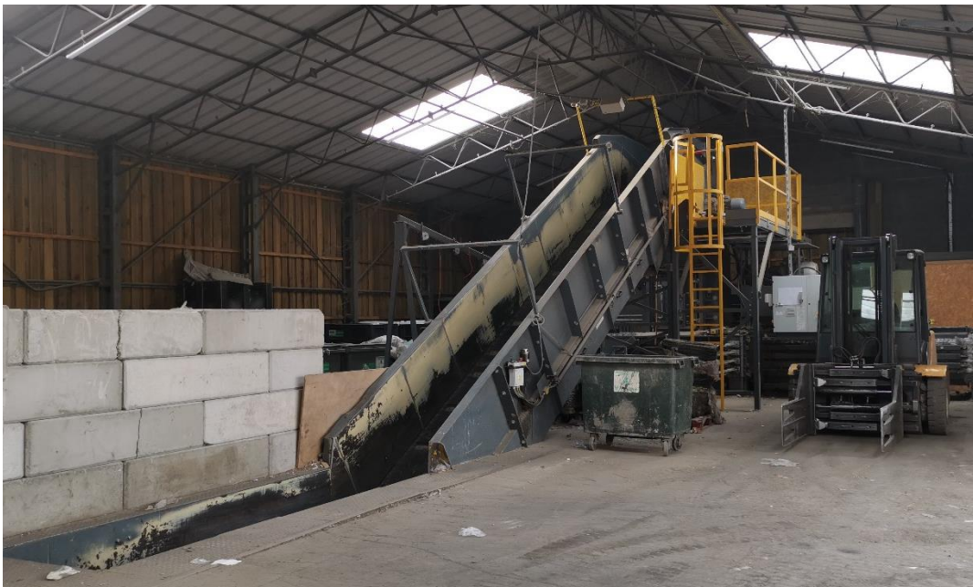
Figure 4. Photographie de la presse à balle