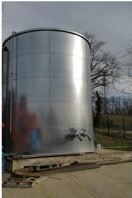
Figure 7. Réserve d'eau incendie

Une réserve incendie de 180 m 3 est située au sud-est du site 1 , à proximité immédiate de l'accès pompier.