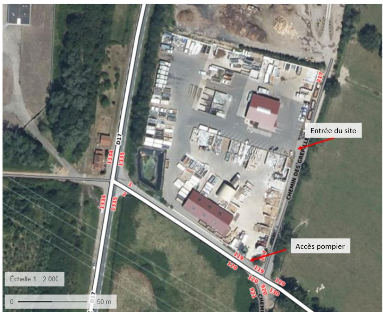
Figure 2. Plan d'accès à la déchèterie

L'entrée sur le site se fait depuis la départementale D17 puis le chemin « Les Grépilles ».