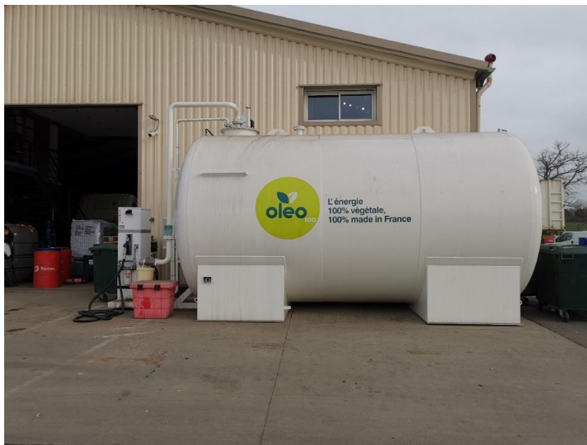
Figure 5. Photographie de la cuve biocarburant

La station est située à l'arrière du bâtiment d'exploitation.