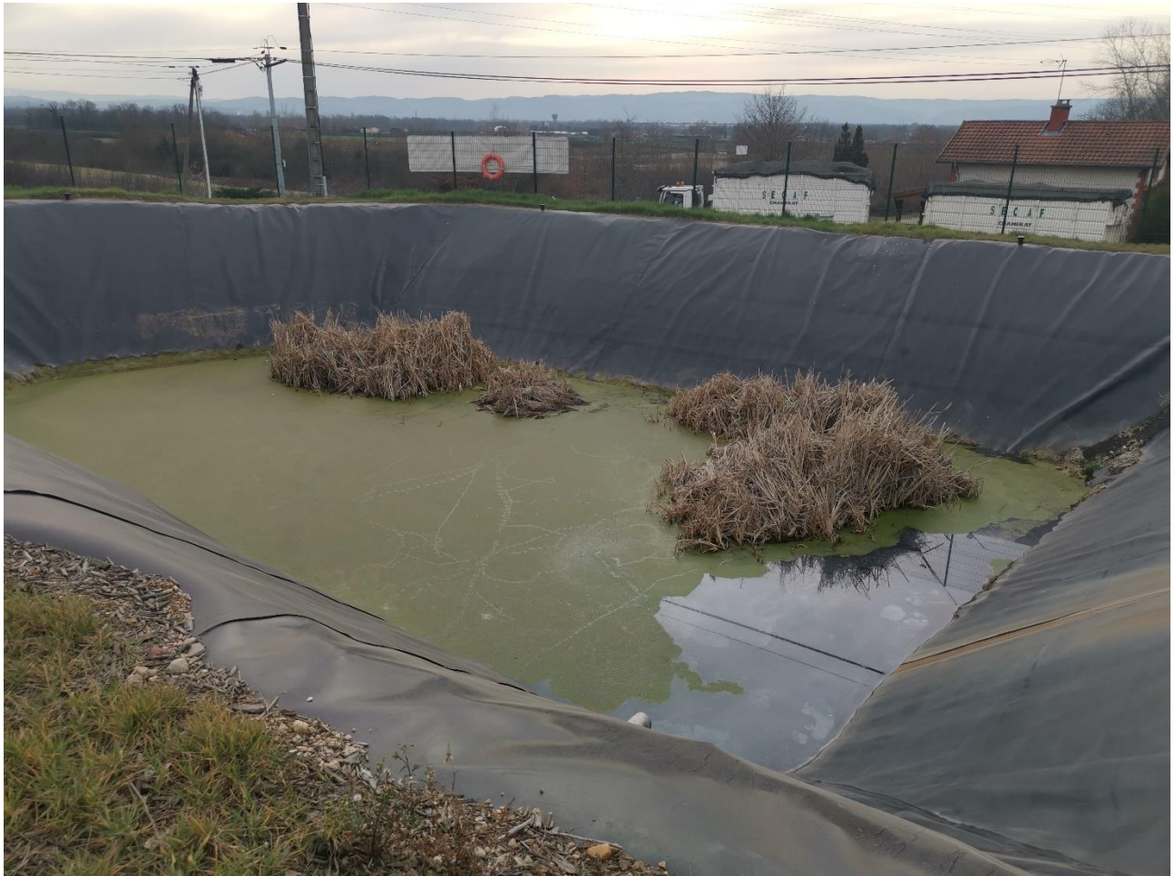
Figure 8. Bassin de rétention des eaux

En cas d'incendie, la rétention des eaux d'extinction d'incendie se fait dans le bassin tampon étanche. Une vanne de confinement en sortie de bassin est actionnée pour empêcher le rejet de ces eaux en cas de sinistre ou pollution.