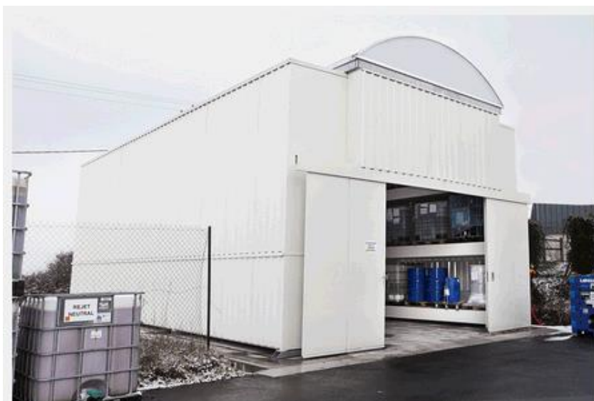
Figure 3. Exemple d'un magasin modulaire

Dans le cadre du projet, un magasin modulaire sera implanté au nord-ouest du site. L'ossature du magasin sera constituée de conteneurs métalliques à rayonnages standards sur trois niveaux adaptés au stockage des DIS.