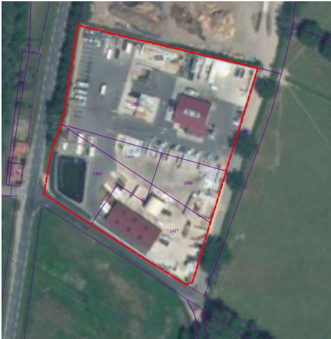
Figure 2. Parcelle d'implantation du site

Le terrain sur lequel est implanté le site appartient intégralement à SECAF-CHAMFRAY. La société est également propriétaire de la parcelle C1481 correspondant à la voie d'accès perpendiculaire au chemin des Grépilles.