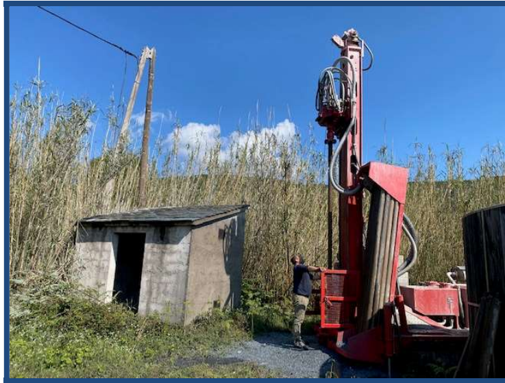
Forage de Salce 2, le 20 avril 2021

RENFORCEMENT DE LA RESSOURCE EN EAU POTABLE DE LA COMMUNE DE CAGNANO