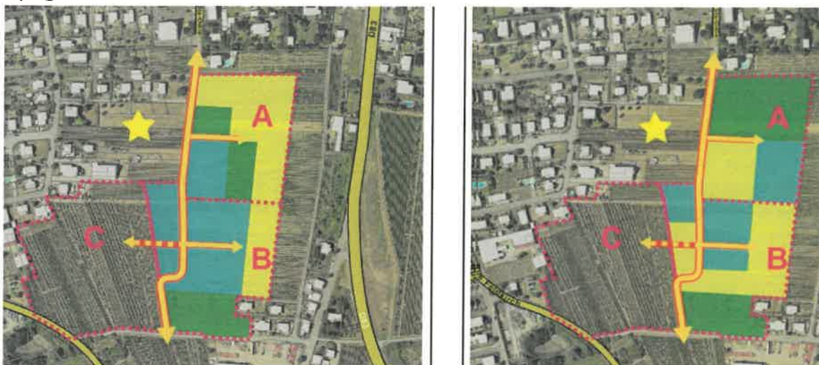
Schéma d'aménagement du secteur AUc « Flachsland » avant (à gauche) et après (à droite) la modification

La nouvelle version de l'OAP du secteur AUc « Flachsland » réduit la surface des espaces dédiés à l'habitat collectif (aplats bleu ci-après) au motif d'« éviter des volumes collectifs trop importants le long de la voie de desserte principale de direction Nord/Sud » (Exposé des motifs, page 6).