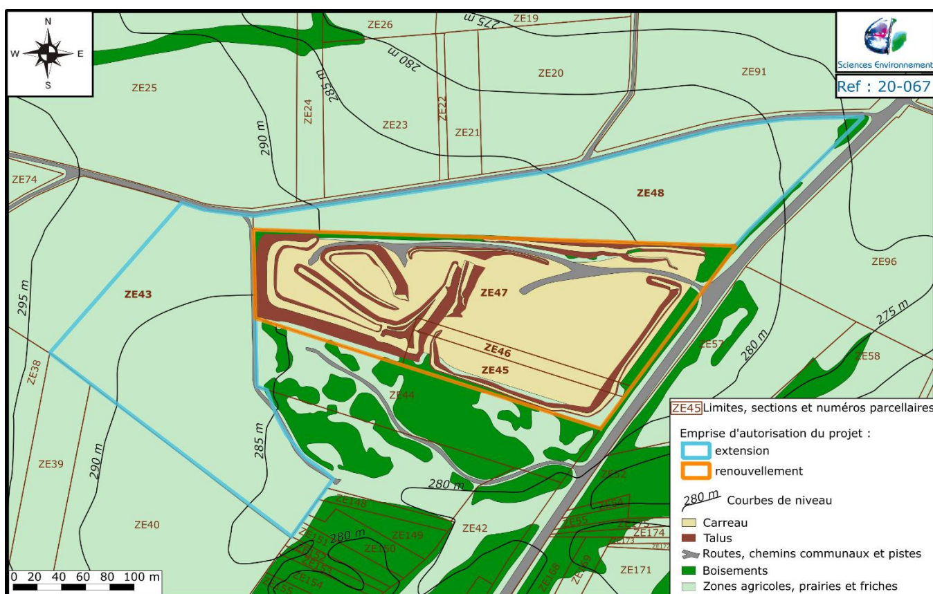
Figure 1 : Extrait du plan cadastral de la commune de Marsannay-le-Bois par rapport aux emprises du projet.