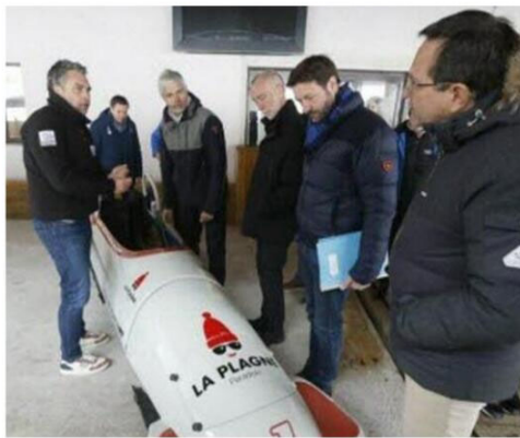
Fabrice Pannekoucke à La Plagne avant son élection à la présidence de la Région Auvergne-Rhône-Alpes, avec Laurent Wauquiez, lors d'une visite du CIO.

Dans le dossier déposé au CIO, il est mis en avant un coût d'organisation des Jeux d'hiver 2030 nettement inférieur aux précédentes éditions en raison notamment de la réutilisation des équipements de 92 piste de