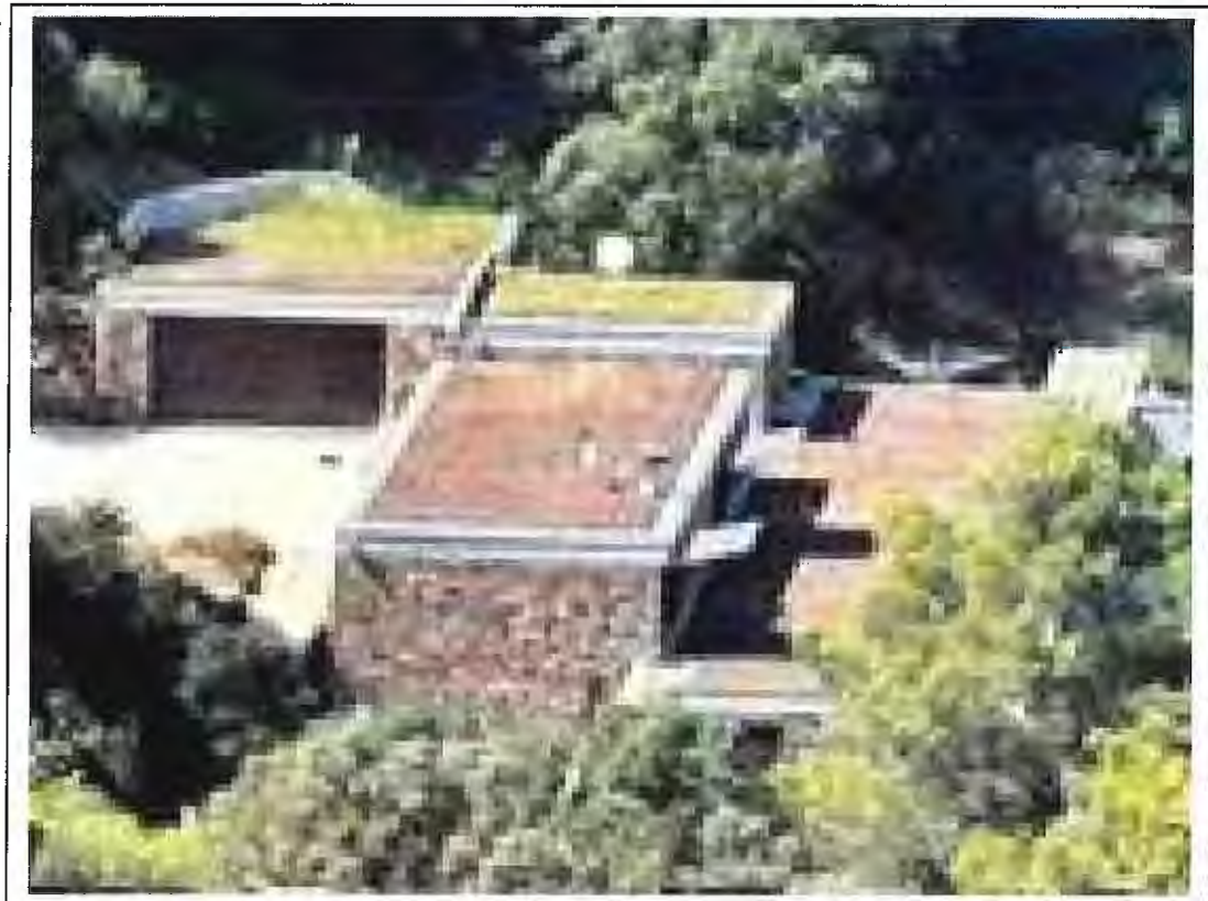
Clichés photographiques depuis la Corniche du Belvédère