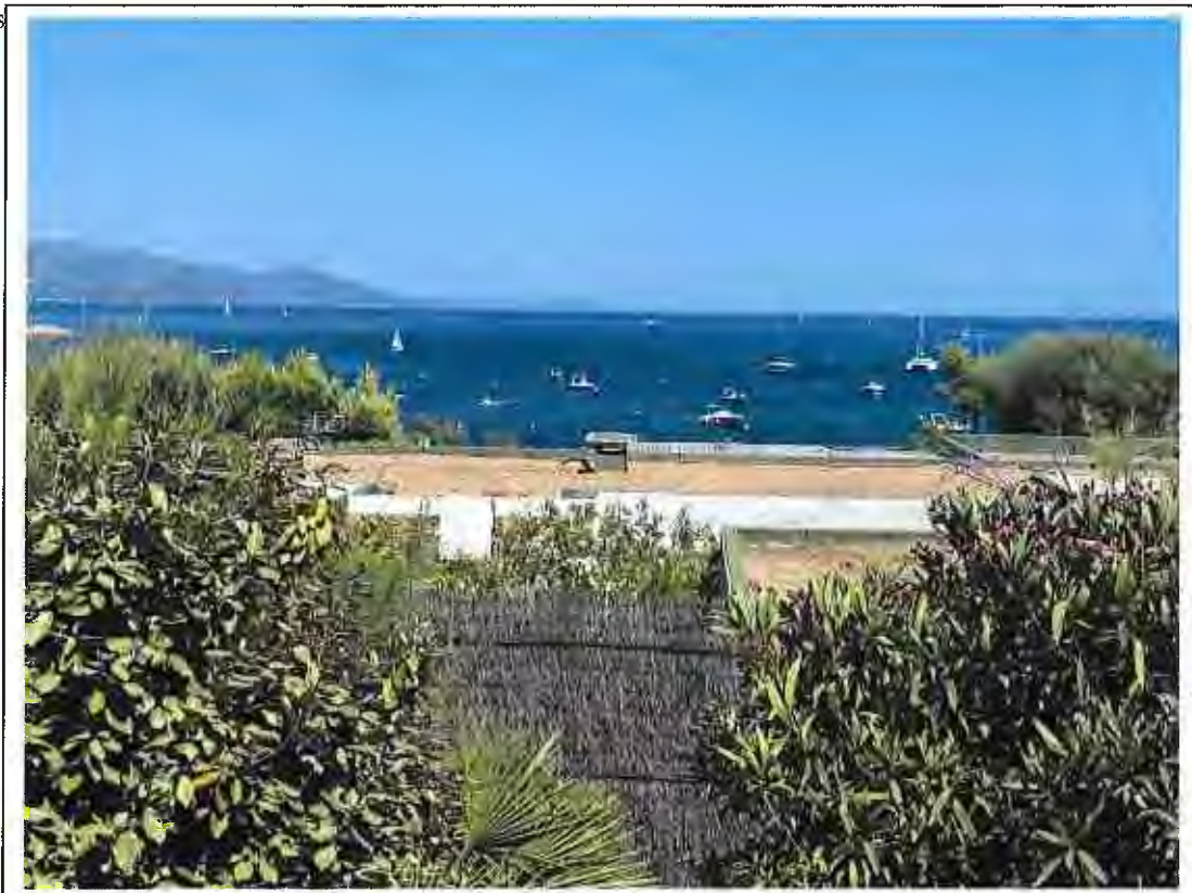
Clichés photographiques pris depuis la Corniche Supérieure