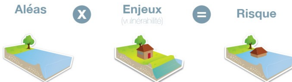
Figure 3 : Croisement des aléas et des enjeux.

Le risque est la rencontre d'un phénomène naturel aléatoire dit aléa , en l'occurrence l'inondation par débordement de cours d'eau, et d'un enjeu (vies humaines, biens matériels, activités, patrimoines) exposé à ce phénomène.