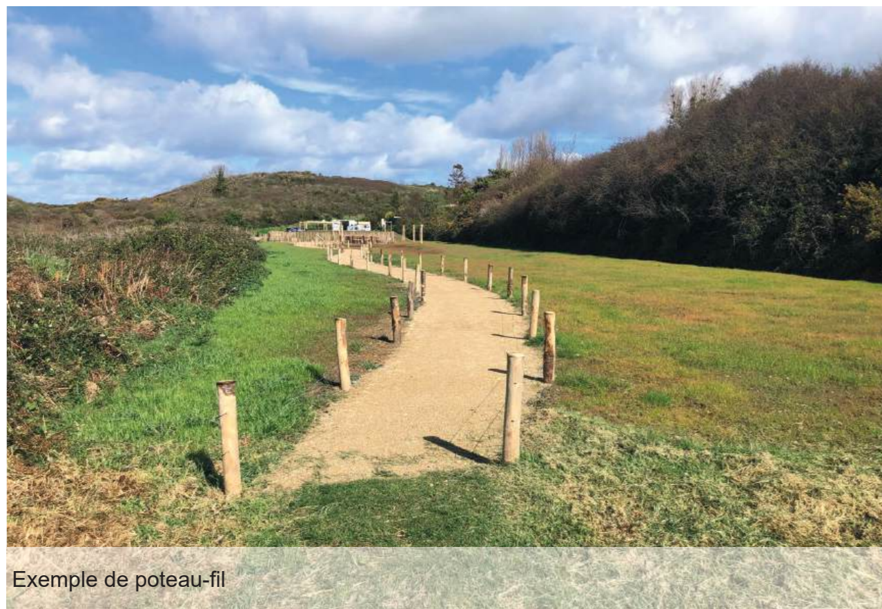
Exemple de poteau-fil