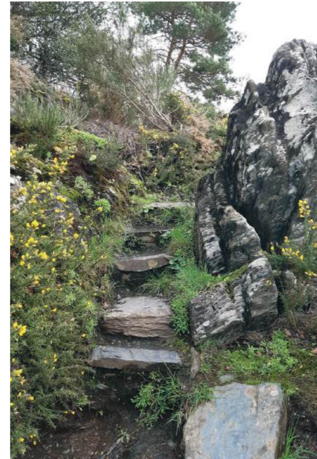
Escalier en pierre présent sur le sentier