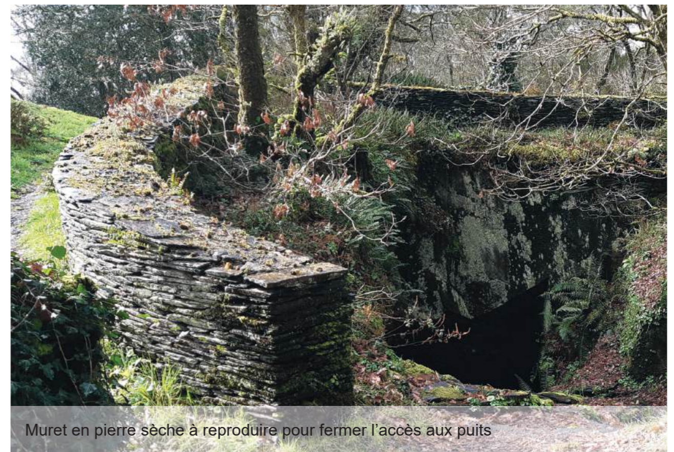
Muret en pierre sèche à reproduire pour fermer l'accès aux puits