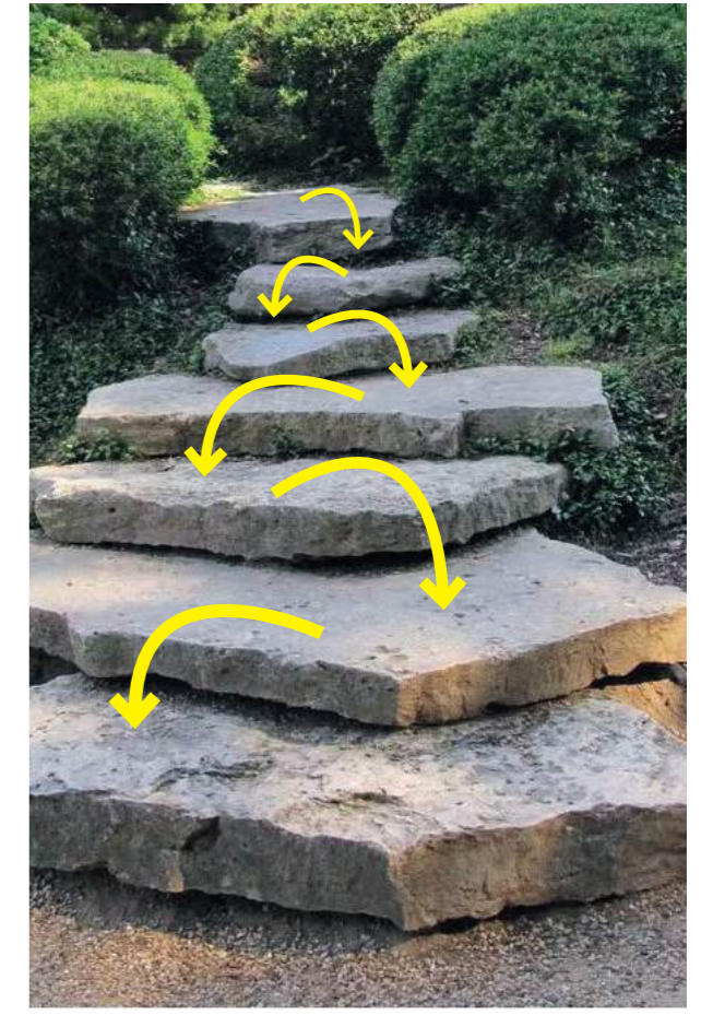
Type d'agencement des pierres à retrouver