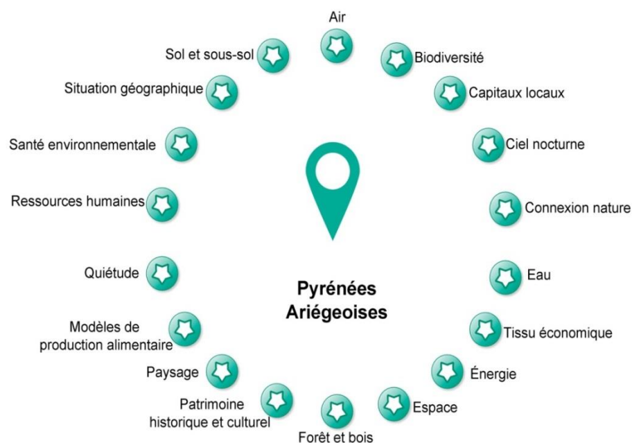
Les 18 ressources identifiées des Pyrénées Ariégeoises

Ces ressources ont été arrêtées par le SMPNR à l'issu d'un travail de recherches bibliographiques, réflexions internes (séminaire équipe et élus-équipe en 2020) et de séquences d'échanges avec les partenaires (Région Occitanie, DREAL, Fédération des Parcs naturels régionaux..) ayant permis d'affiner la définition et la portée de l'approche, et de la valider.