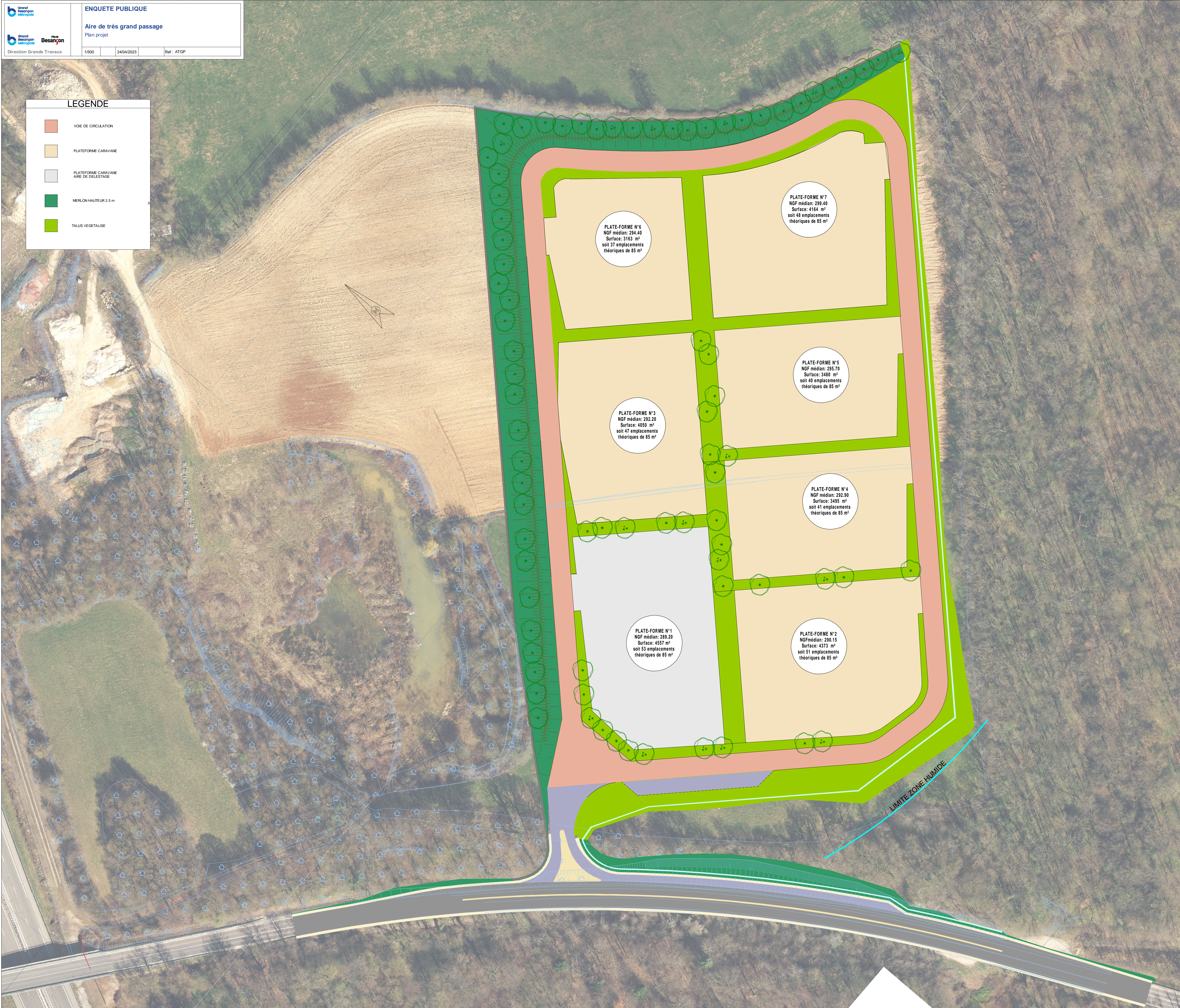
PLATE-FORME N°6 NGF médian: 294.40 Surface: 3163 m 2 soit 37 emplacements théoriques de 85 m 2

PLATE-FORME N°7 NGF médian: 299.40 Surface: 4164 m 2 soit 48 emplacements théoriques de 85 m 2