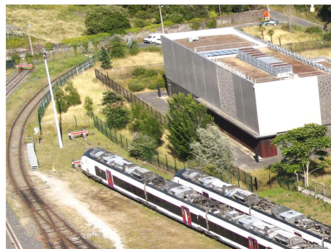
Vue 03 par drone