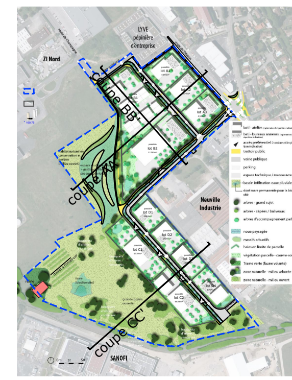
plan de localisation des coupes