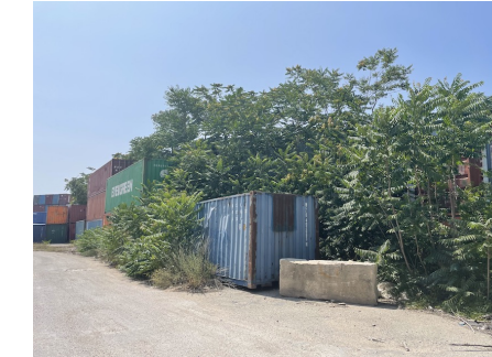
Bosquet d'alliantes colonisant un délaissé terroux.