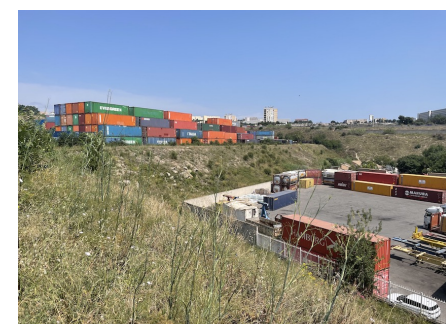
Talus avec couvert herbacé plantes annuelles (fenouil).