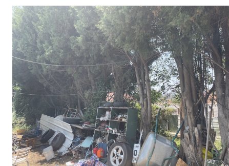
Rideau de cyprès : base dégarnie et le plus souvent envahie de lierres sur 3 à 4 m de hauteur; lieu de stockage de matériaux divers.