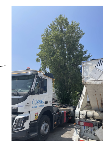
Peuplier isolé dans un parking.