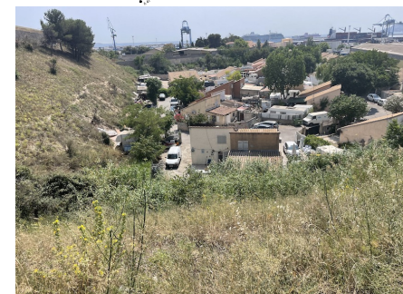
Massif de cannes de Provence occupant le bas d'un talus herbacé.