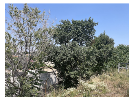
Micocoulier décharné (à gauche) et orme (à droite).