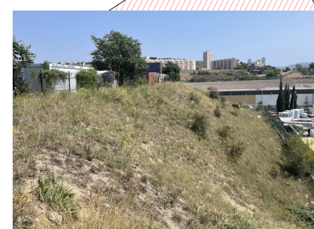
Talus avec couvert herbacé ponctué de touffes d'iris, de ronces et de genêts.