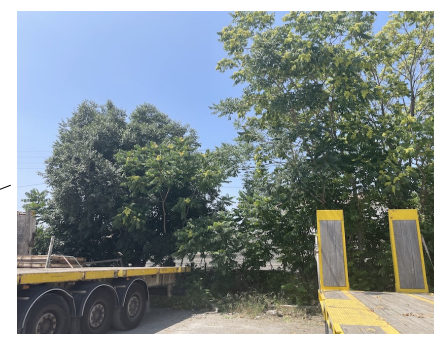
Micocoulier intégré dans un rideau de jeunes alliantes.