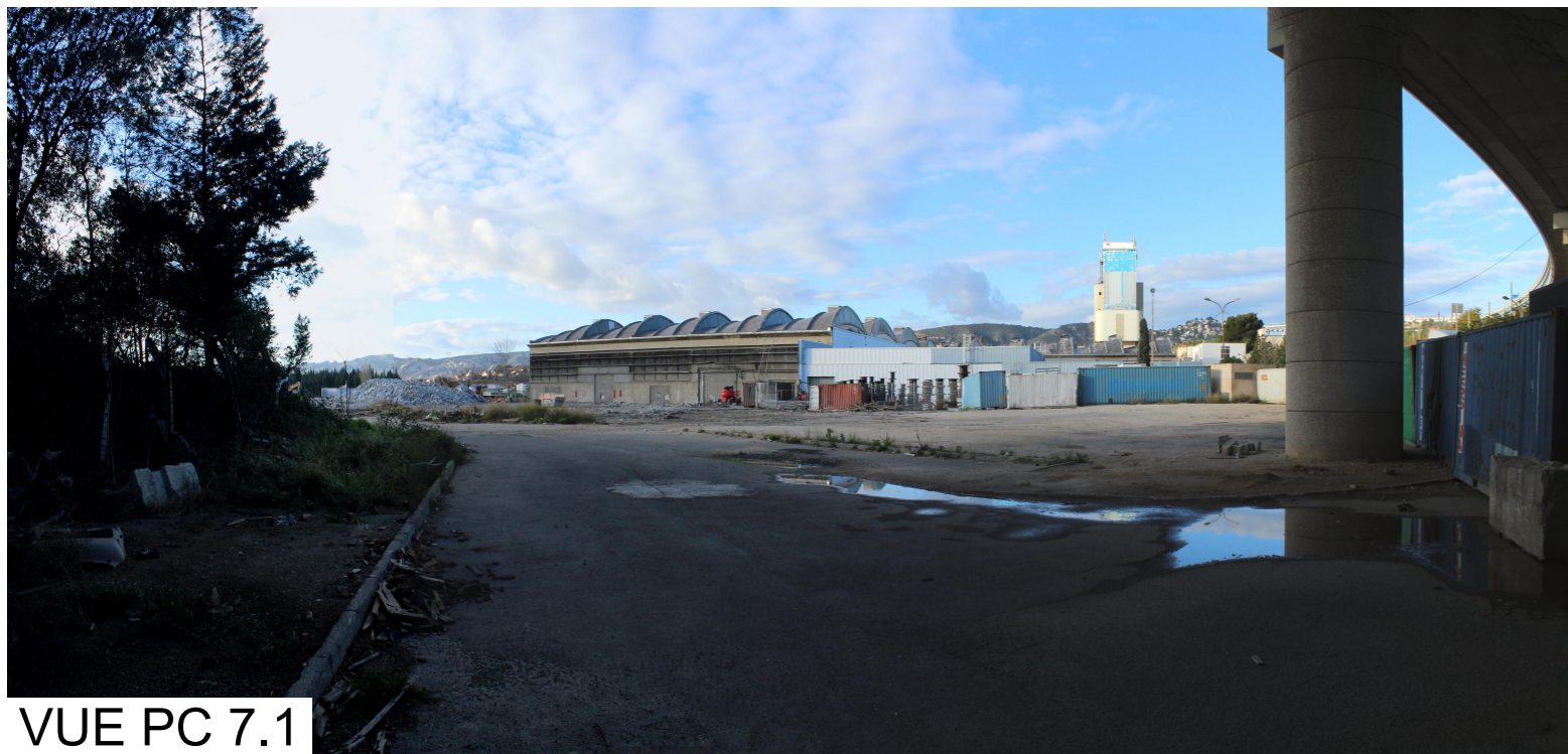
VUE PC 7.1