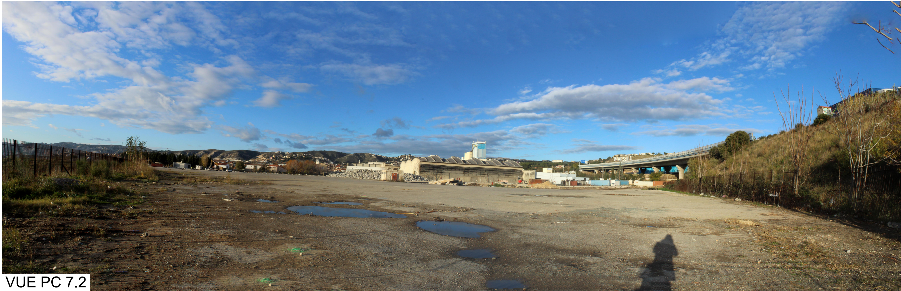
VUE PC 7.2