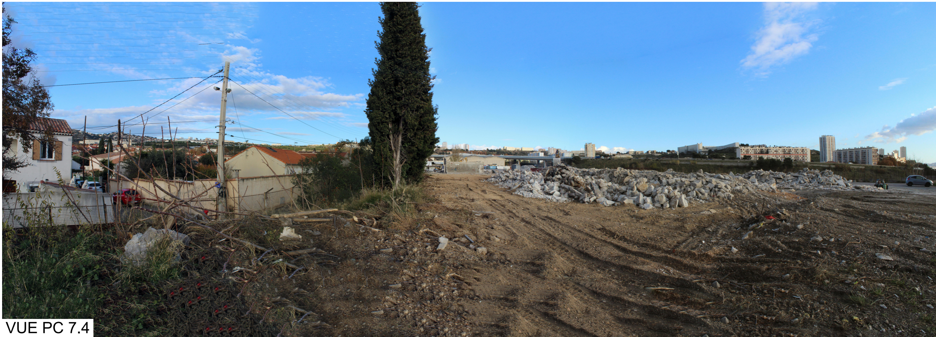
VUE PC 7.4