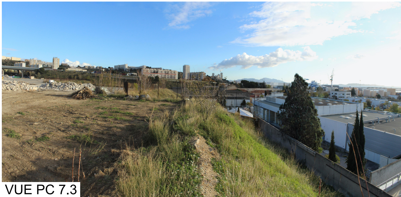
VUE PC 7.3