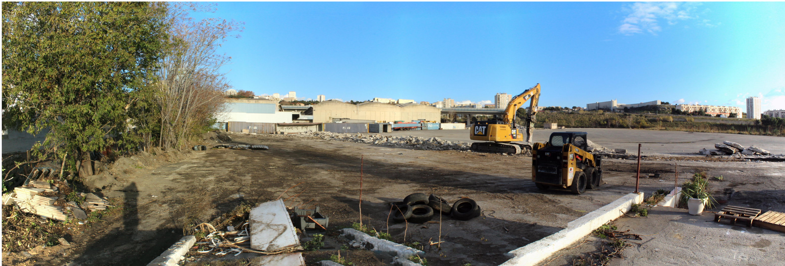
VUE PC 7.6