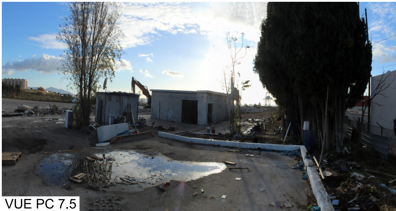
VUE PC 7.5