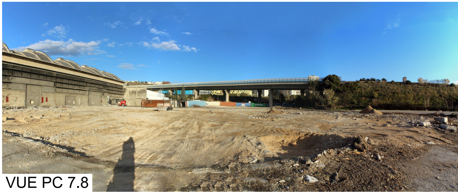
VUE PC 7.8