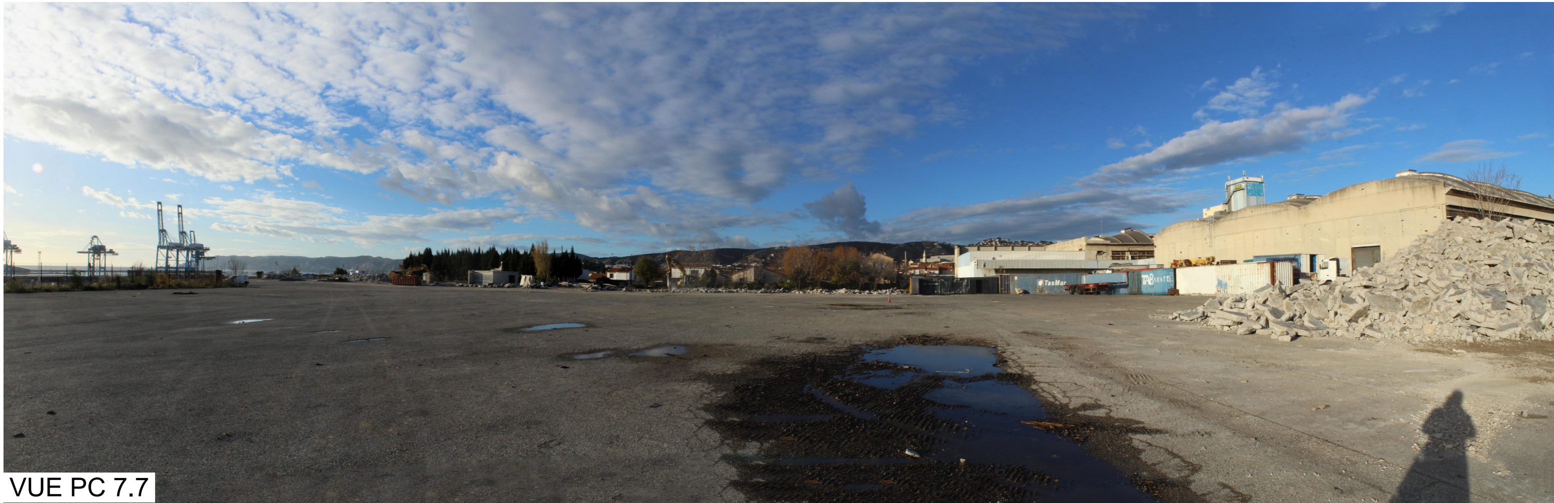
VUE PC 7.7