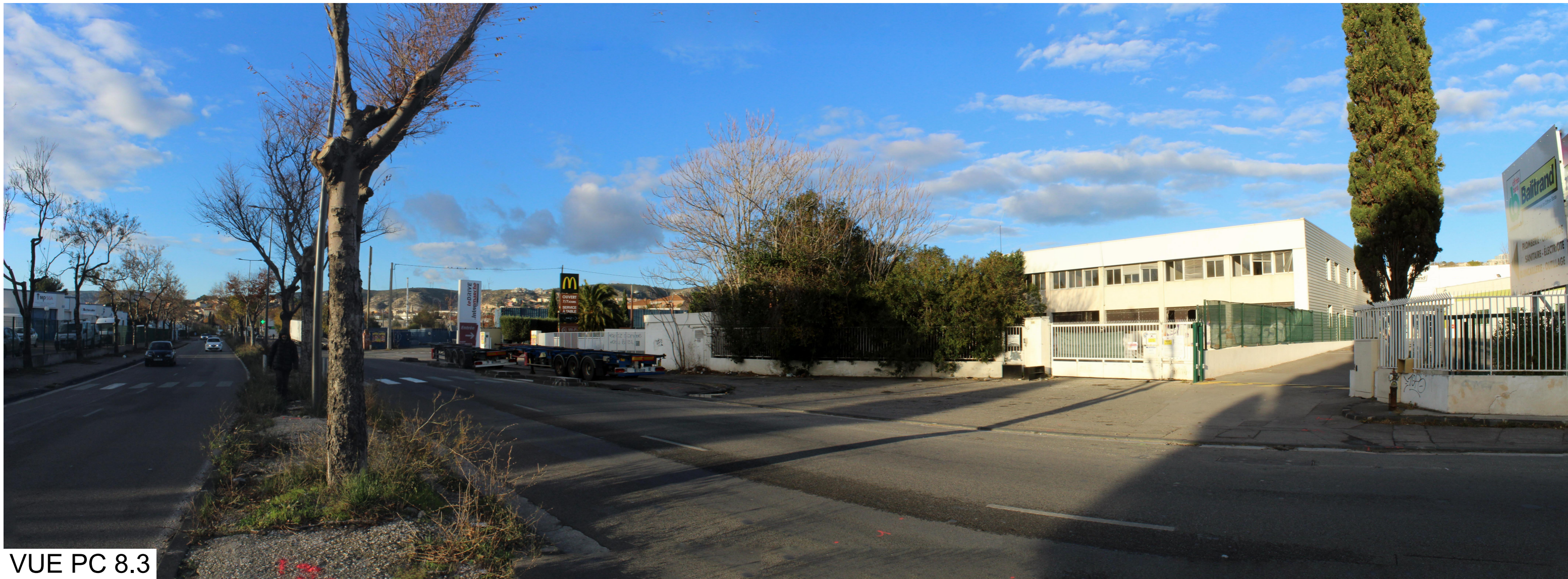
VUE PC 8.3