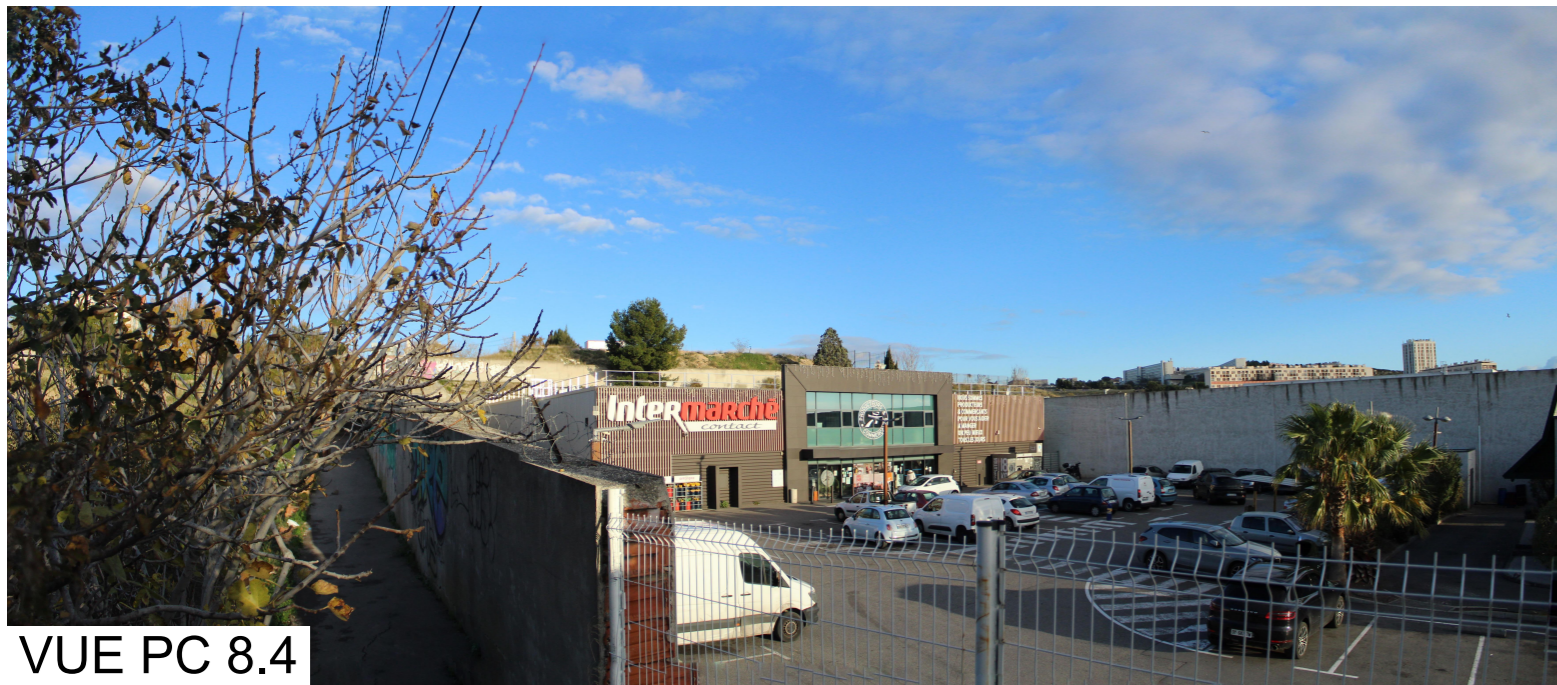
VUE PC 8.4