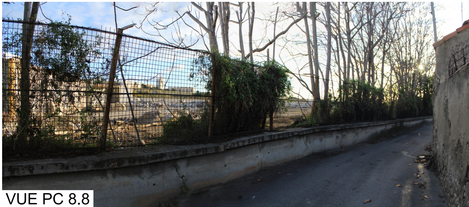
VUE PC 8.8