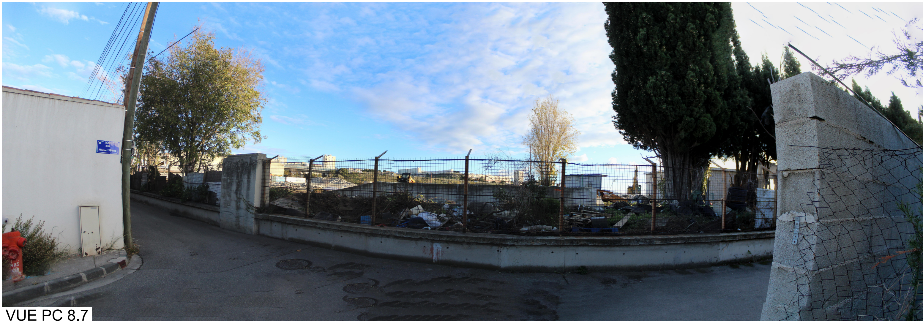
VUE PC 8.7