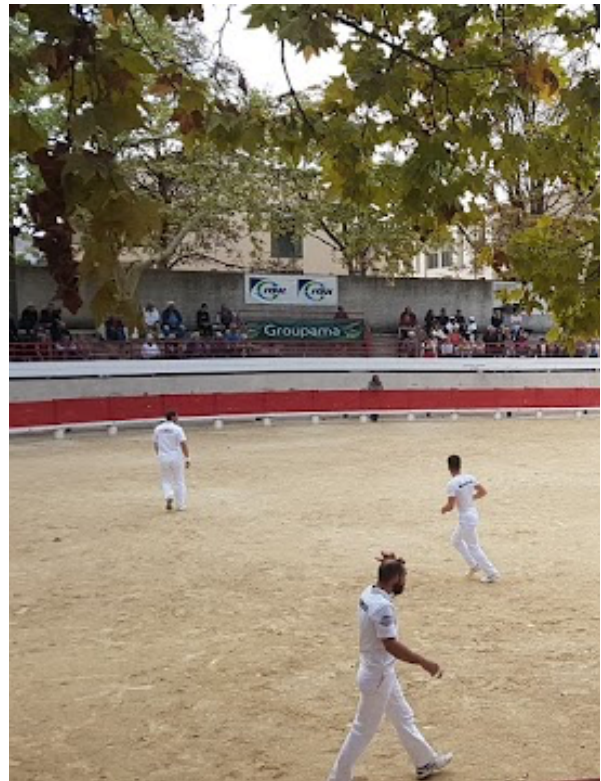
Arènes Robert Brès