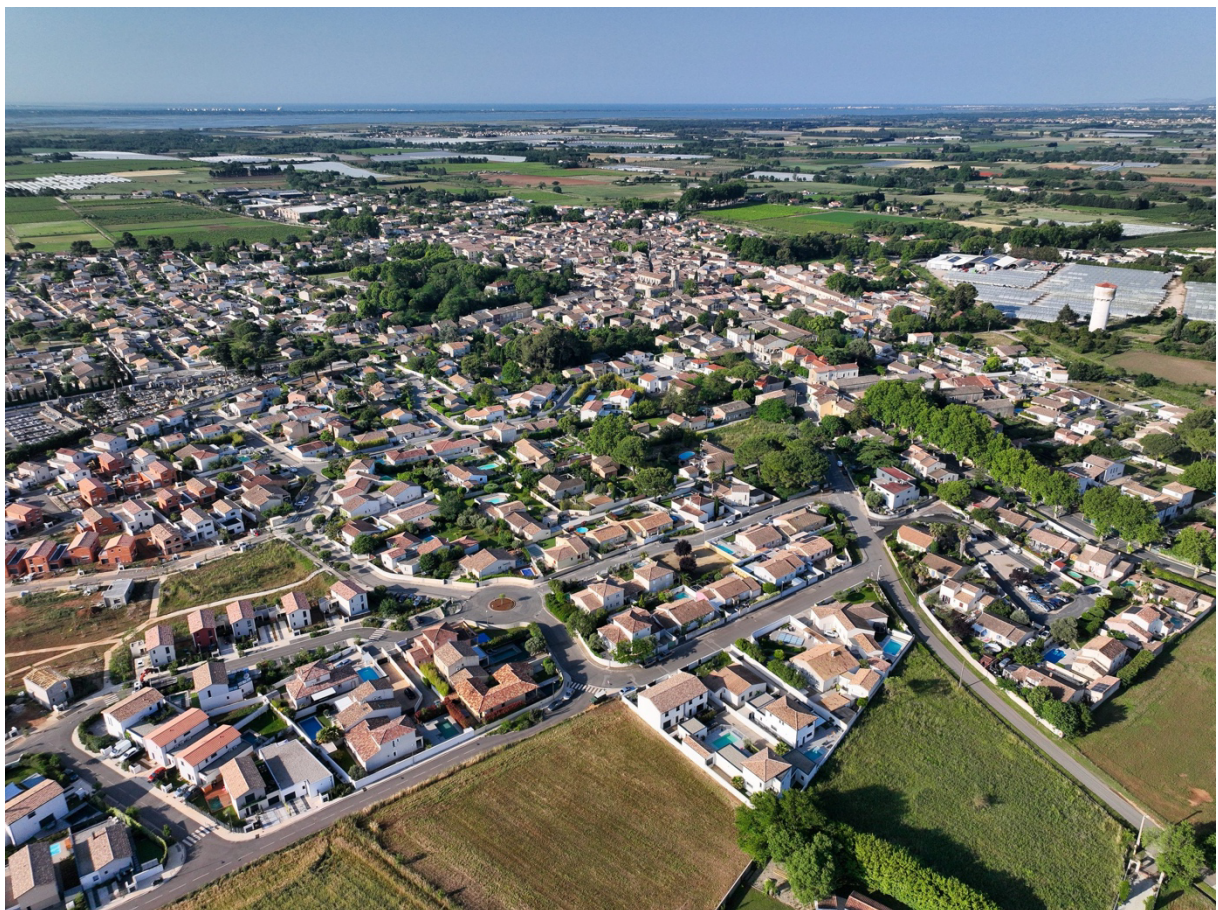
Vue aérienne du tissu urbain de la commune de Lansargues

D'un point de vue patrimonial, la commune est dotée d'un centre historique, de deux bâtiments classés/inscrits Monuments Historiques, et d'un ensemble villageois caractéristique des villages agricoles et vigneron de l'Hérault, et présentant une homogénéité tout-à-fait intéressante. La présente notice porte sur la modification du Périmètre Délimité des Abords des Monuments Historiques.