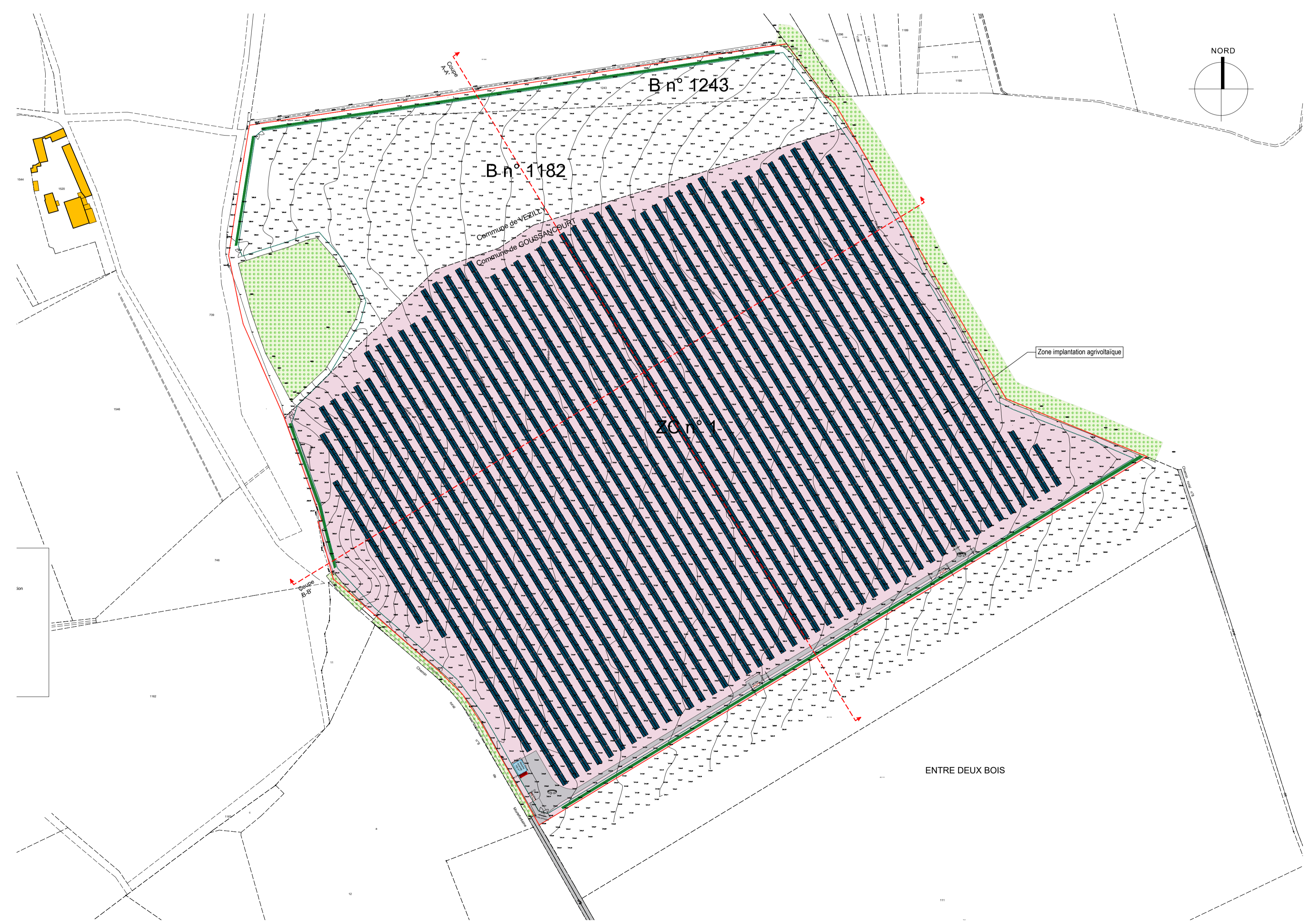
Repérage de la zone projet Echelle : 1/ 2 500