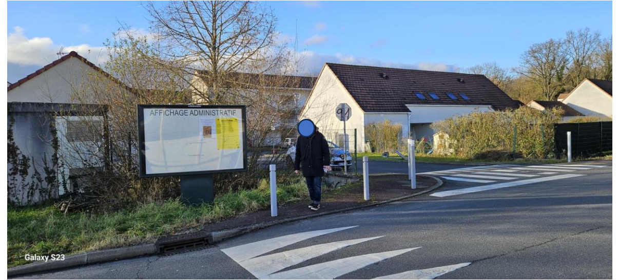
Rue des Folies – Quartier des Folies