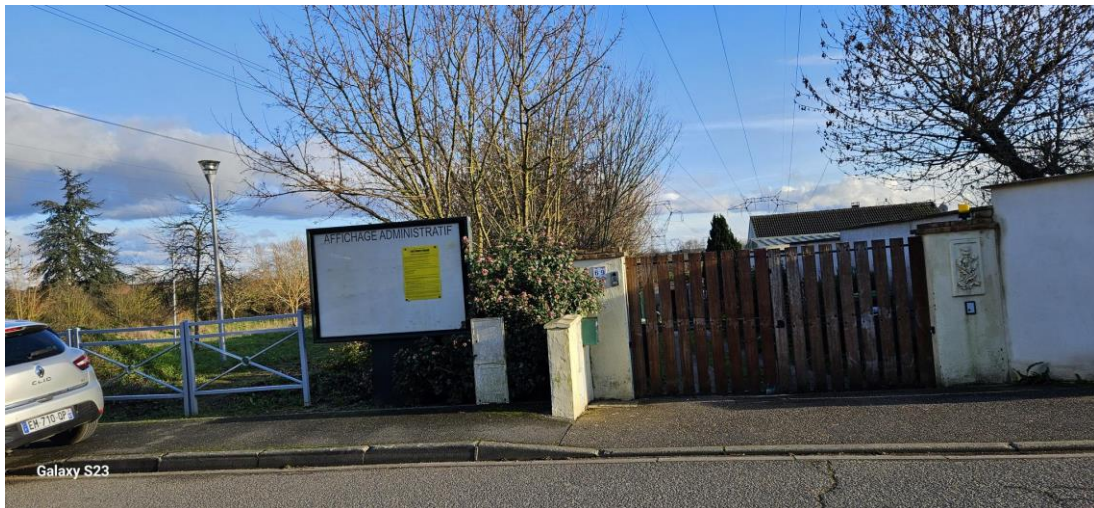
Chemin du Bois des Fosses – Quartier des Folies (à la hauteur du n°69)