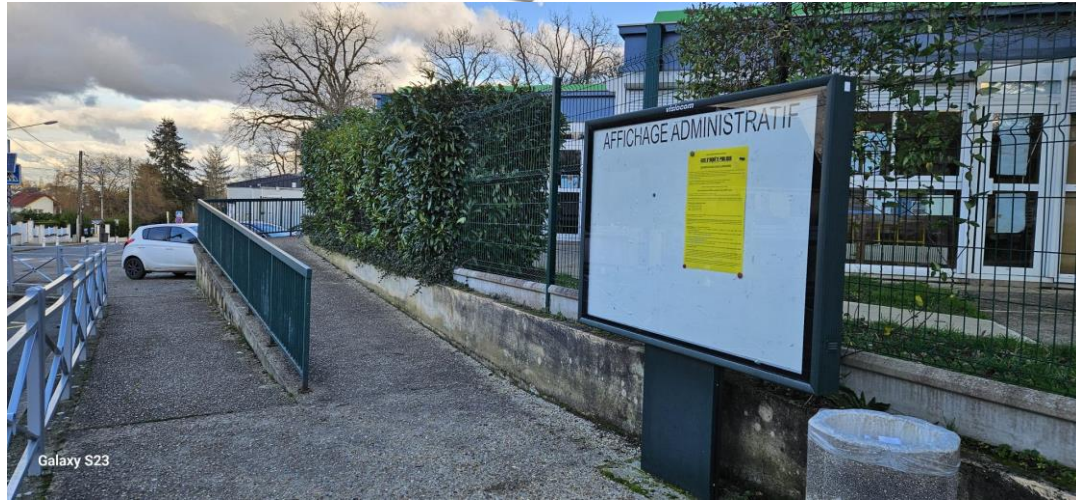
Groupe scolaire Joliot Curie