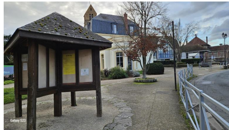
Mairie – 3, rue René Dècle