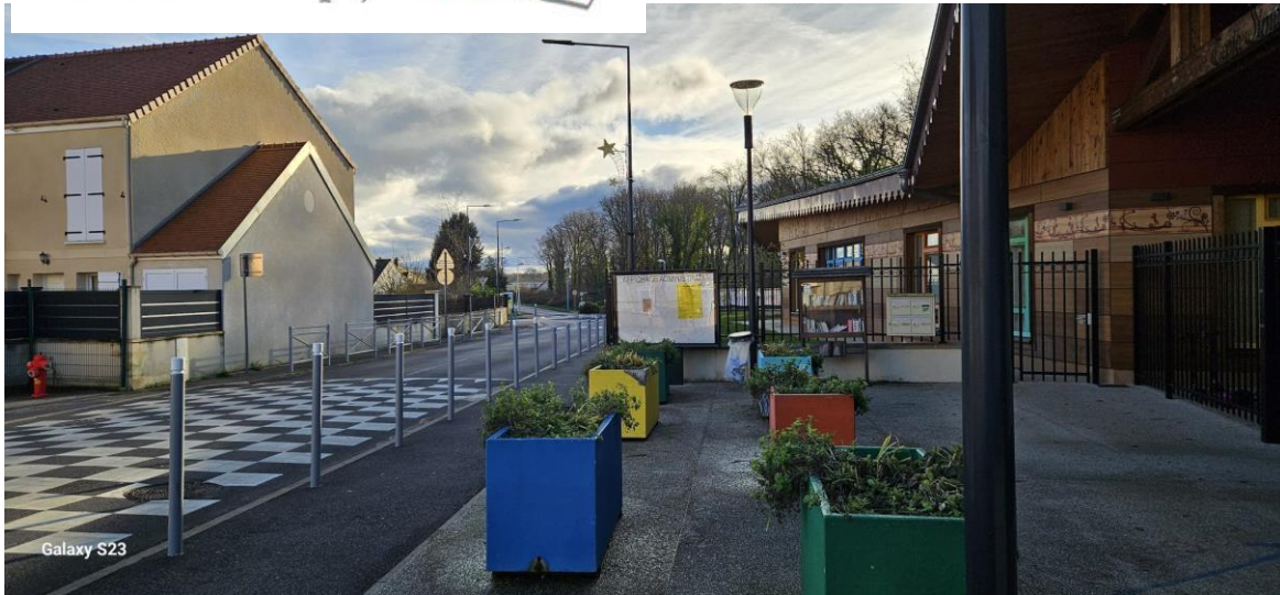
Groupe scolaire Simone Veil - Quartier des Folies