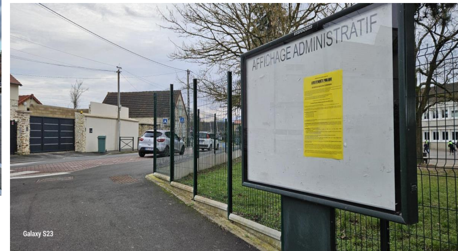
Groupe scolaire Paul Langevin 5