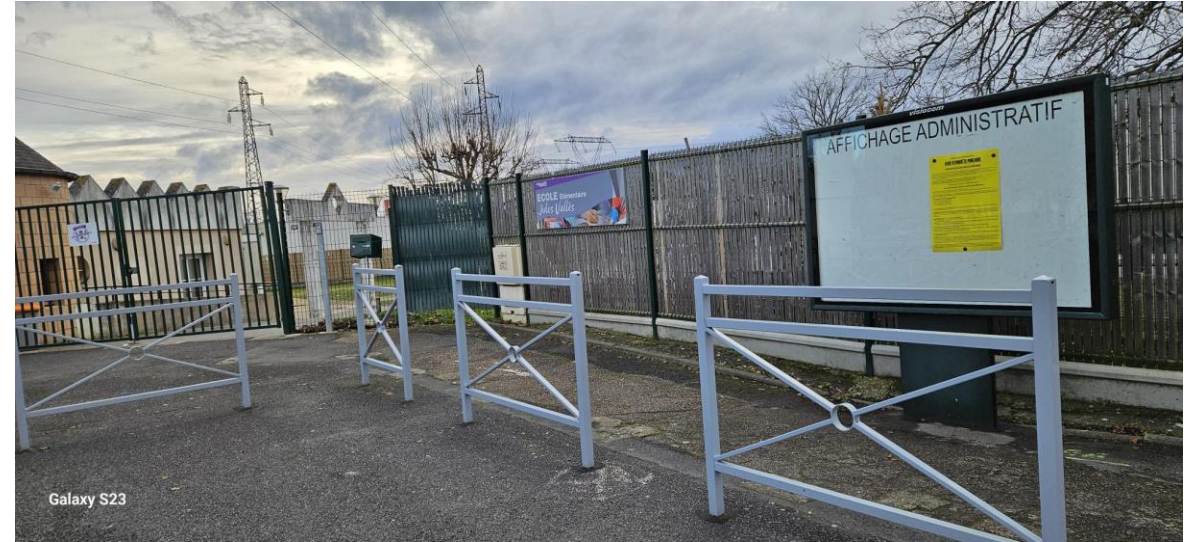
Groupe scolaire Jules Vallès