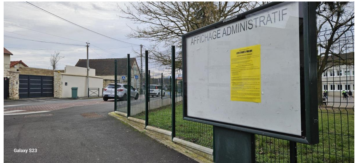
Groupe scolaire Paul Langevin