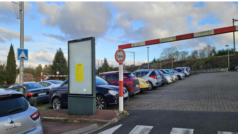
Gare- Parking – rue de la Gare