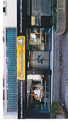
Saint-Germain-Lès-Arpajon – Nouveau salon de toilettage installé à la place de l'ancienne pharmacie au sein de la résidence Louis Babin