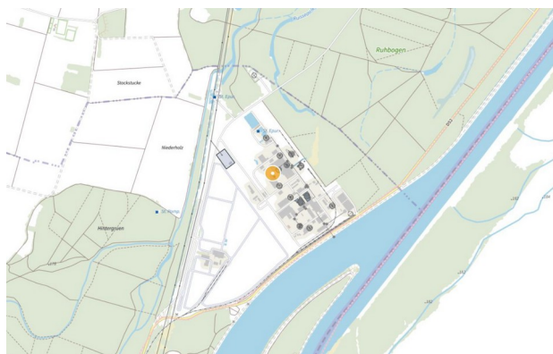
Figure 1: localisation du site Jungbunzlauer

La société Jungbunzlauer exploite, depuis 1992, à Marckolsheim des installations de production d'acide citrique, de gluconates, de glucose, d'acide lactique et d'érythritol.