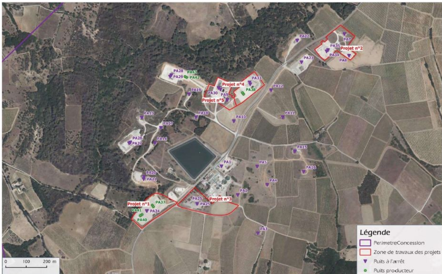
Figure 2 : délimitation des zones d'implantation et des puits actuels