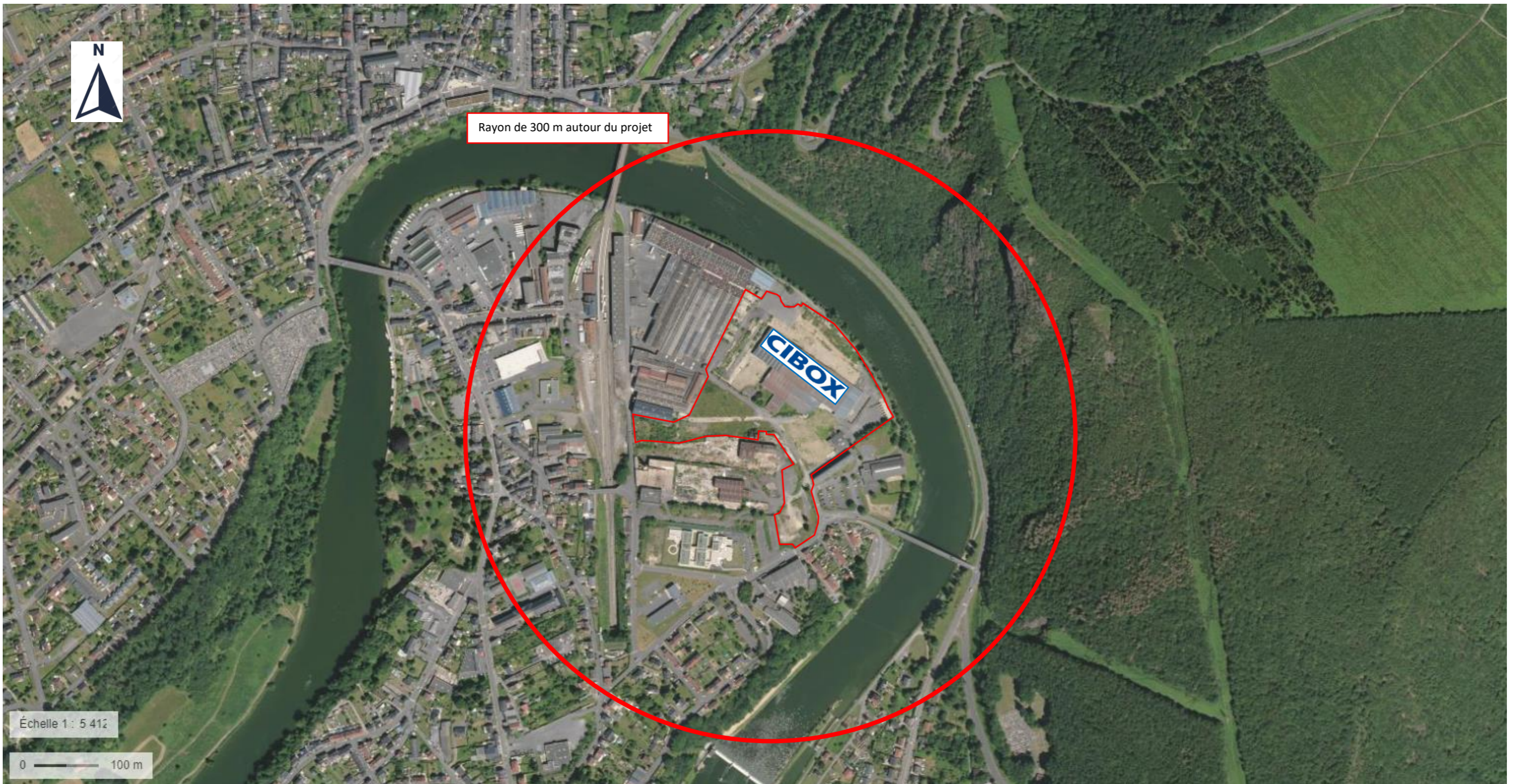
Plan de situation AVEC 1/10ème DU RAYON D’AFFICHAGE Septembre 2023