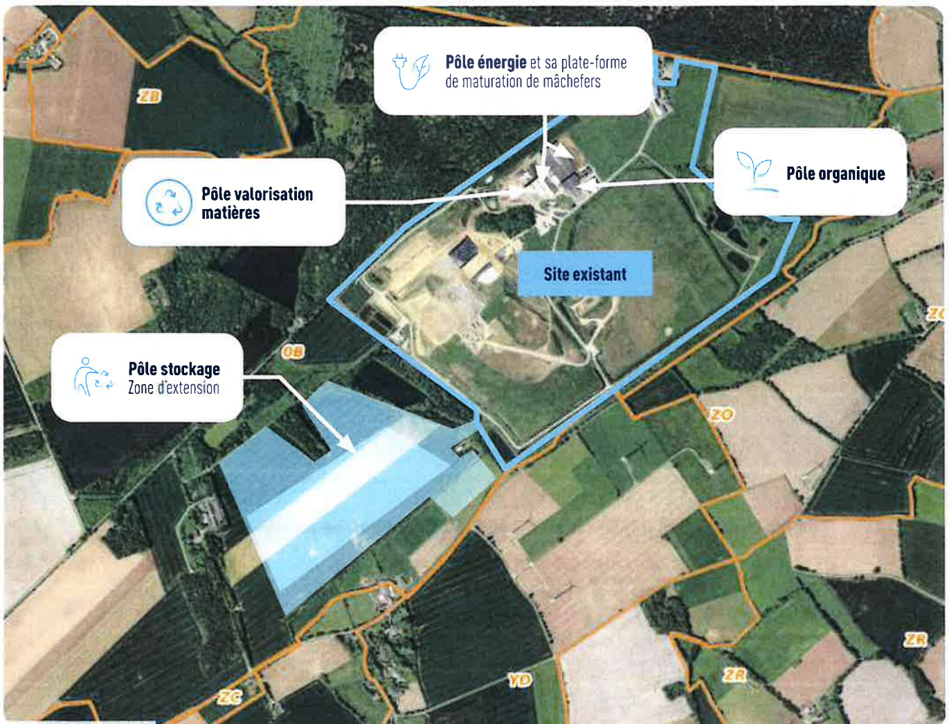
Plan général d'implantation