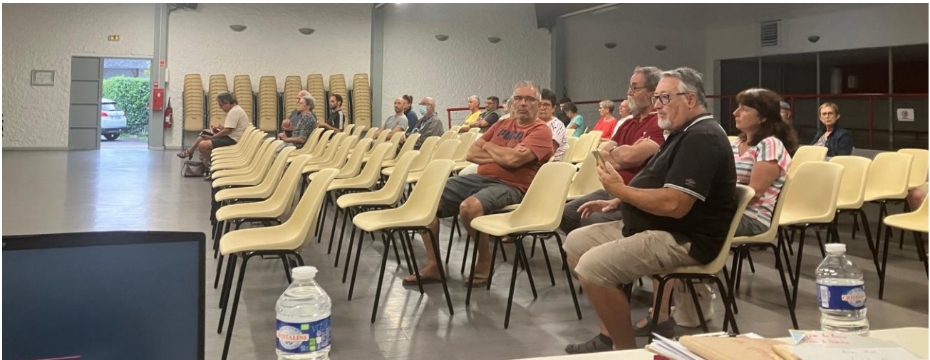
Dernière réunion publique sur le volet règlementaire du PLU, le 4 septembre 2024.

Plusieurs remarques et questions ont été posées par les habitants. Les élus et le bureau d'études présents ont apporté les précisions demandées. Chacune de ces réunions a accueilli une cinquantaine de personnes environ.