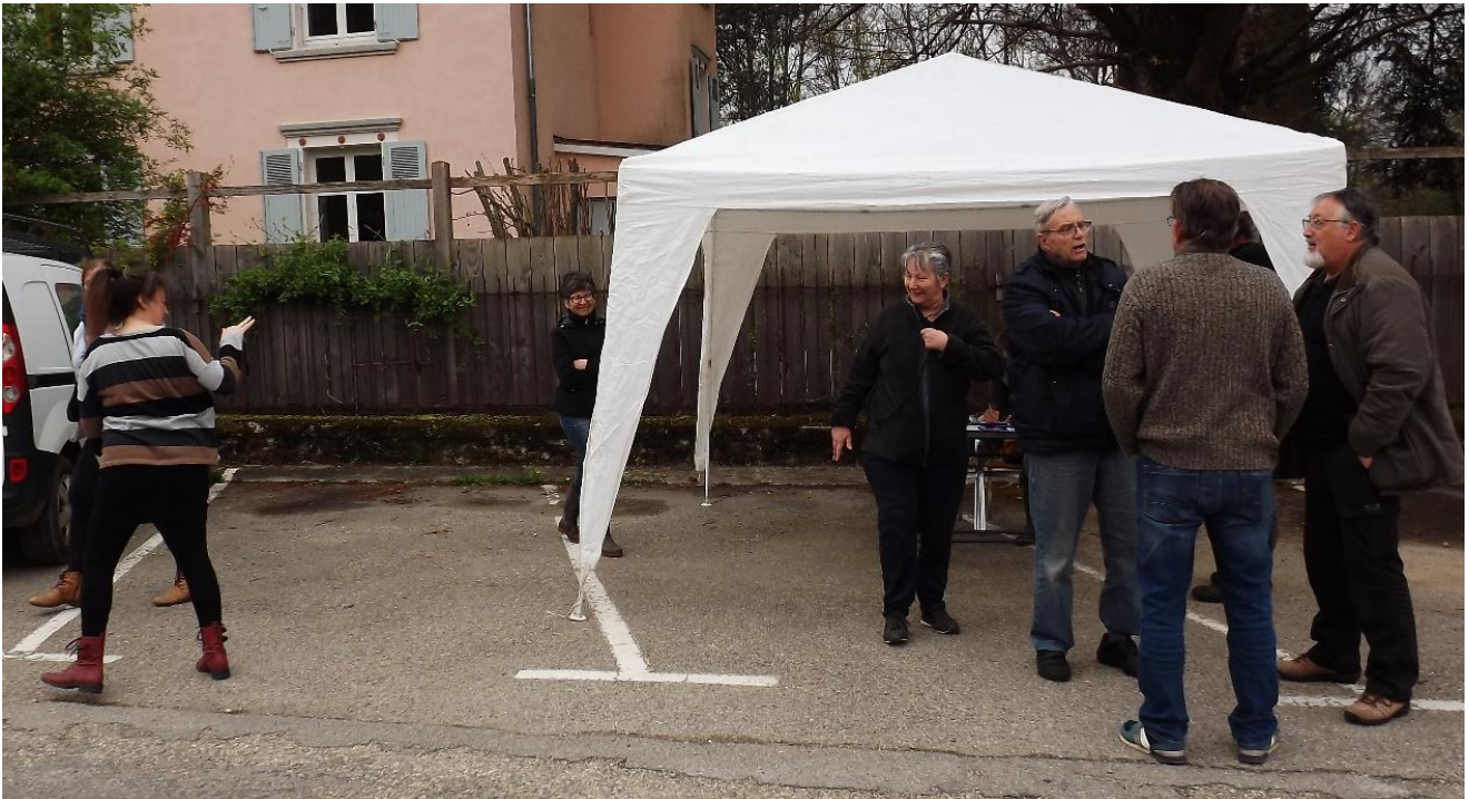
Stand tenu lors de la visite sur site, pour sensibiliser les habitants sur le lancement de l'étude urbaine et les inviter à venir échanger sur l'OAP