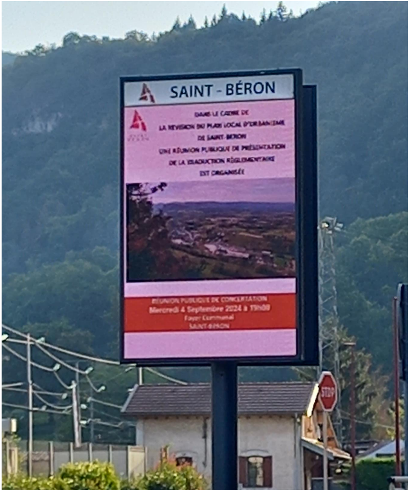
Affichage de la réunion publique sur la traduction réglementaire de la révision du PLU de Saint-Béron, sur le panneau lumineux en entrée du centre-boug, face à la Mairie et la Gare